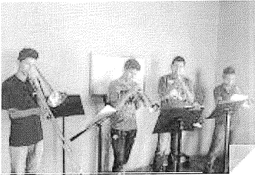
ACTIVIDAD DESARROLLADA Notas Tenidas. realizada el día 16 de Octubre de 2017.