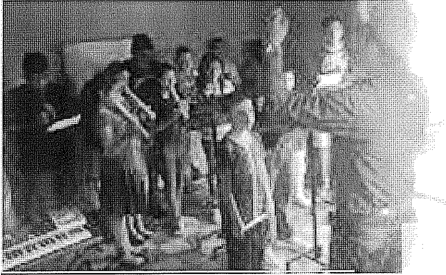
ACTIVIDAD DESARROLLADA Lectura musical. realizada el día 04 de Octubre de 2017.