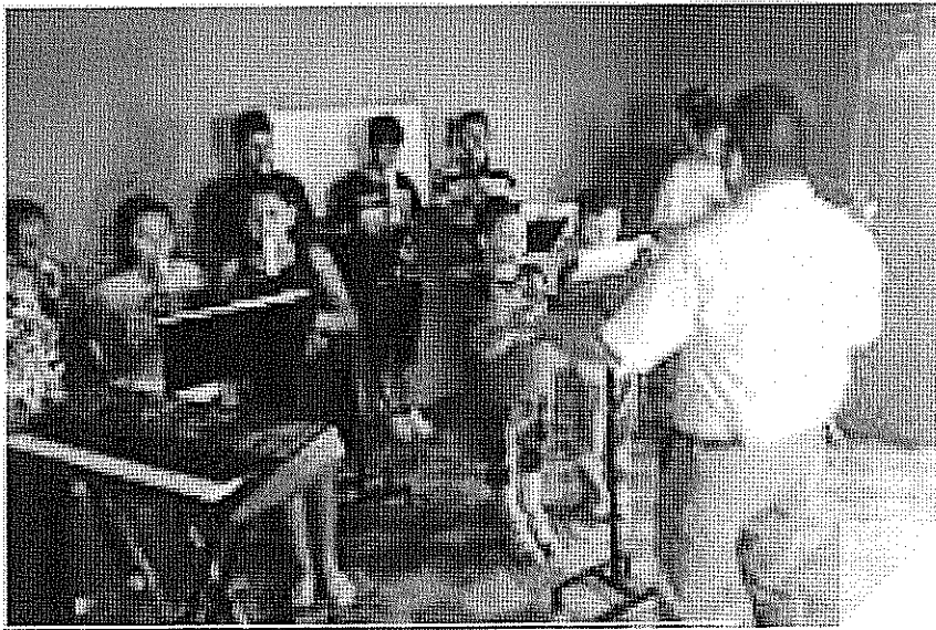
ACTIVIDAD DESARROLLADA Escala Cromatica. realizada el día 27 de Octubre de 2017.