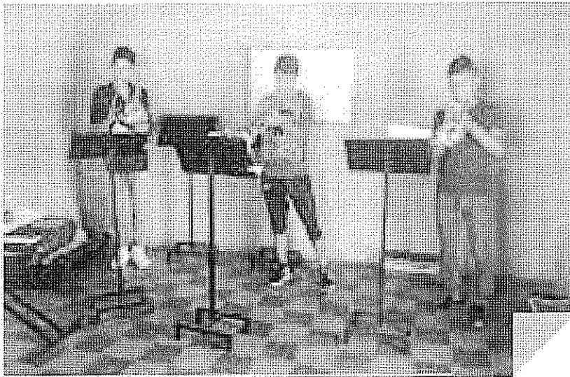
ACTIVIDAD DESARROLLADA Ligadura. realizada el día 09 de Octubre de 2017.